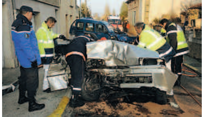
Les secours s'affairent autour de la BX dans laquelle le gendarme est resté coincé. Au second plan, la Kangoo que conduisait le médecin retraité.

«Le conducteur de la Citroën s'était arrêté quelques minutes devant chez lui. Son passager venait de sortir de la voiture lorsqu'il a vu la Kangoo lui foncer dessus. Il a juste eu le temps de se jeter dans l'embrasement de la